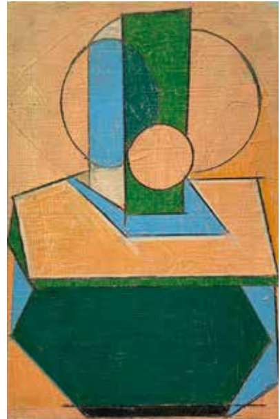
©Lien Buysens 'kitchen stories', 2023, gouache and colored pencil on cardboard, 22 x 14,5 (not framed)