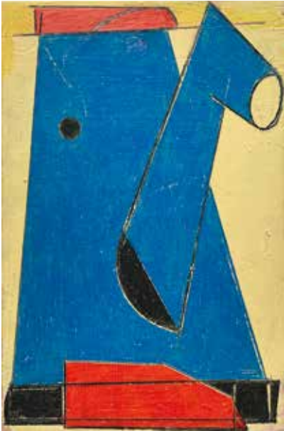
©Lien Buysens 'kitchen stories', 2023, gouache and colored pencil on cardboard, 22 x 14,5 (not framed)