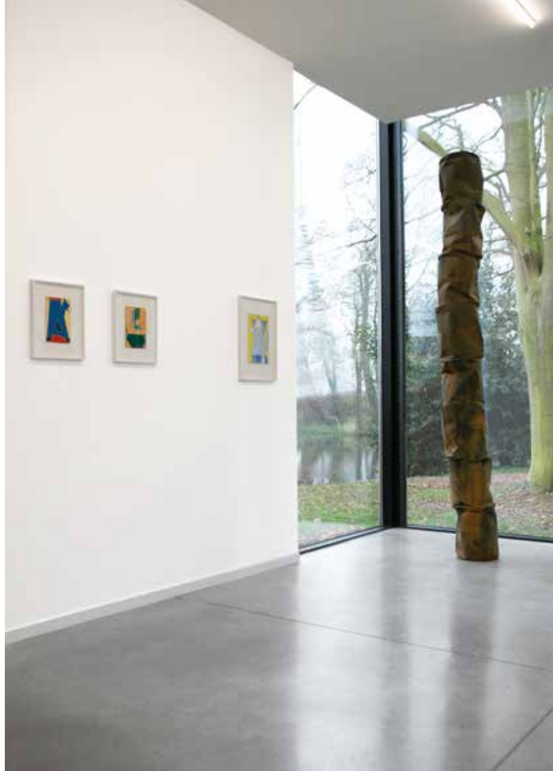
expo view 'FOLDED STORIES'