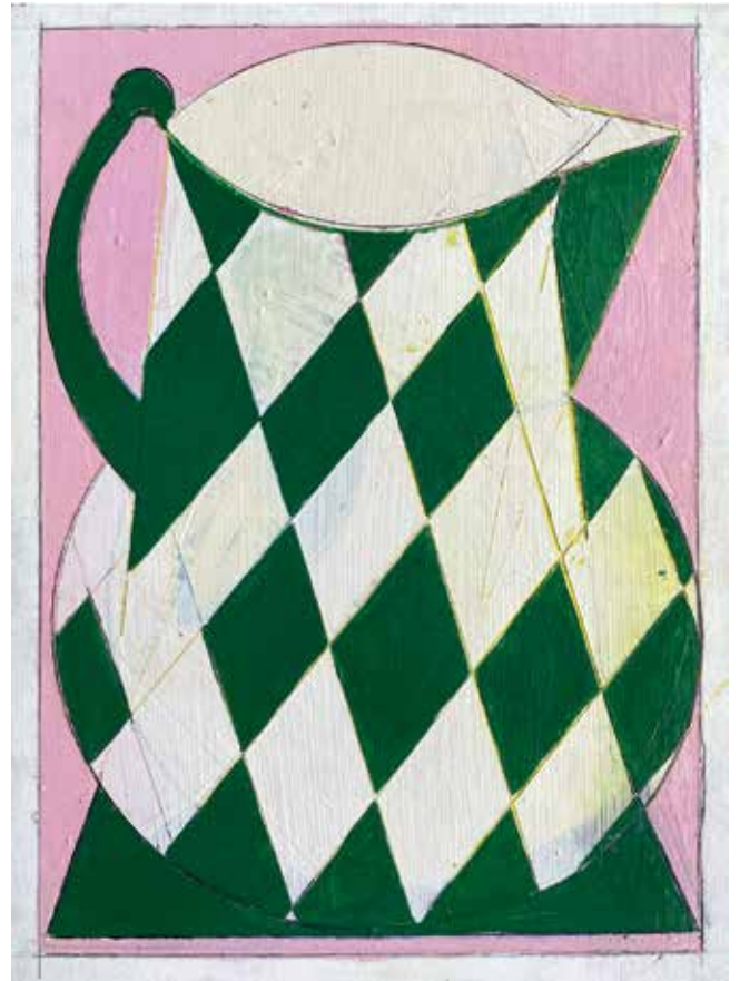
©Lien Buysens 'kitchen stories', 2023, gouache and colored pencil on wood, 28,5 x 22 cm (not framed)