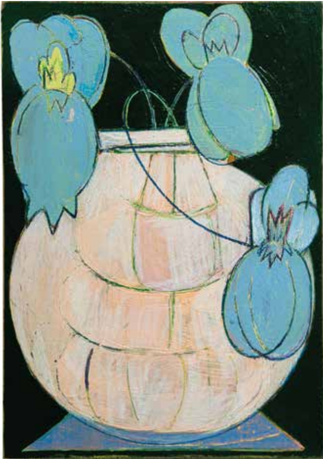
©Lien Buysens 'kitchen stories', 2023, gouache and colored pencil on wood, 23 x 16,5 cm ©Lien Buysens 'another day', 2023, gouache and colored pencil on cardboard, 15 x 11 cm (not framed)