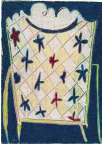
©Lien Buysens 'another day', 2023, gouache and colored pencil on cardboard, 15 x 11 cm (not framed)