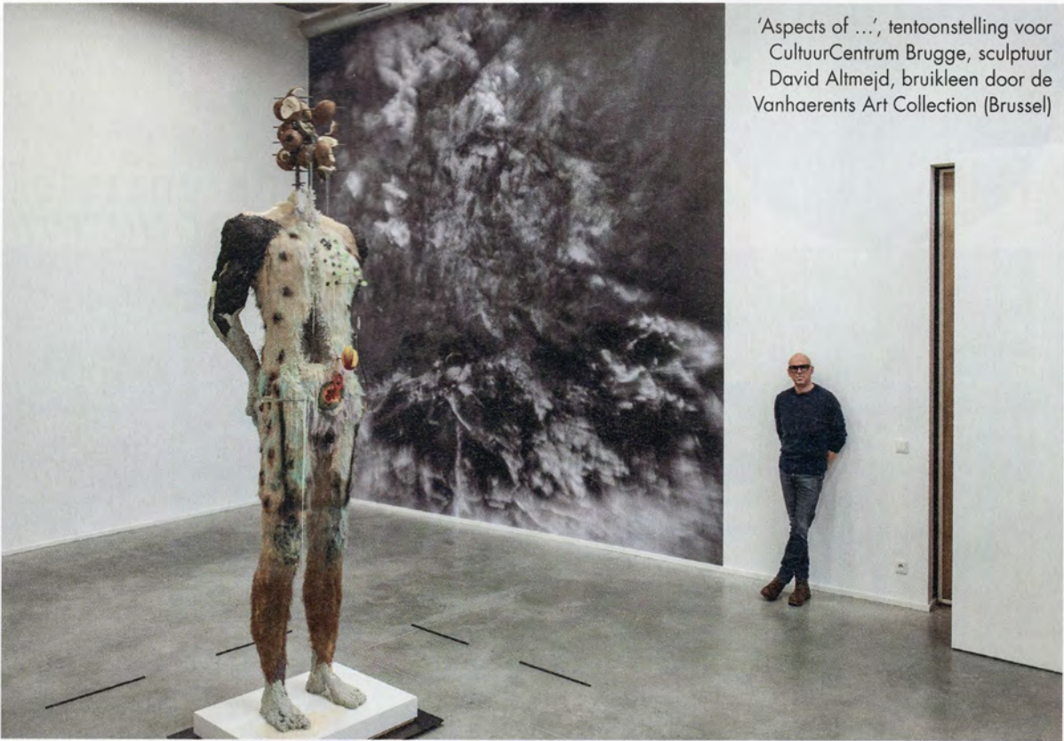
'Aspects of ...', tentoonstelling voor CultuurCentrum Brugge, sculptuur David Altmejd, bruikleen door de Vanhaerents Art Collection (Brussel)